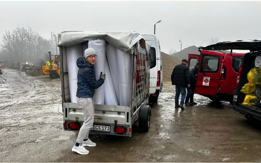
Unser Vorstand beim Verladen von Matratzen für die Ukraine