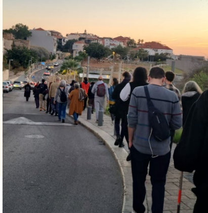
Auf dem Weg von Jaffa nach Gaza

In einem politischen Klima, das von Krieg, massiver Gewalt, Repression und gesellschaftlicher Polarisierung geprägt ist, schafft Zochrot geschützte Räume für Austausch, Reflexion und Organisation. Aktivist:innen erhalten dort politische Bildung, strategisches Training und konkrete Handlungsinstrumente: von Kampagnenarbeit über Kommunikationsstrategien bis hin zu digitaler Sicherheit.