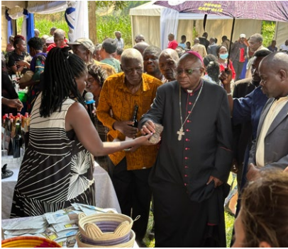
Erzbischof Paul Ssemogerere auf der Segnungs- und Eröffnungsveranstaltung des neuen Kornspeichers