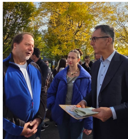
Cem Özdemir im Gespräch beim Nachhaltigkeitstag

Oder beim Jugendtag in Untermarchtal. Jugendliche setzten sich in einem Escape Room zur „Reise eines T-Shirts“ interaktiv mit Produktionsbedingungen, Konsumententscheidungen und Wiederverwendung auseinander. Spielerisch wurde erfahrbar, was in Zahlen und Marktanalysen oft abstrakt bleibt: Jedes Kleidungsstück steht für globale Zusammenhänge, jede Entscheidung zählt. Bildung bedeutet hier, Verantwortung zu verstehen und Handlungsspielräume zu erkennen.