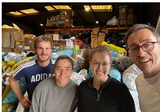
Das Team der Aktion Hoffnung in Calais

Alle sieben Transporte folgen demselben Leitgedanken: gezielte Hilfe in enger Partnerschaft, getragen von der Solidarität vieler Menschen, die Kleidung spenden, sammeln und weitergeben, Menschen, die die Transporte ermöglichen sowie von Unternehmen, die Sachspenden leisten.