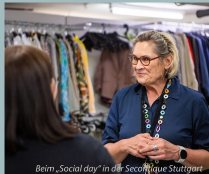
Beim „Social day“ in der Secontiquen Stuttgart

Die SECONTIQUEN sind mehr als Verkaufsf lächen. Sie sind niedrigschwellige