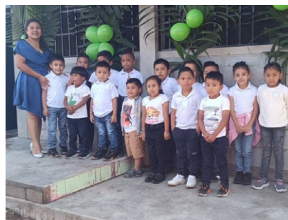
Eröffnung der sanierten Schule in San Pablo

Heute profitieren 343 Schülerinnen und Schüler sowie 45 Kindergartenkinder von deutlich verbesserten Lernbedingungen. Das Projekt stärkt die Bildungsinfrastruktur in einer strukturell benachteiligten Region und schafft verlässliche Rahmenbedingungen für schulische und frühkindliche Bildung.