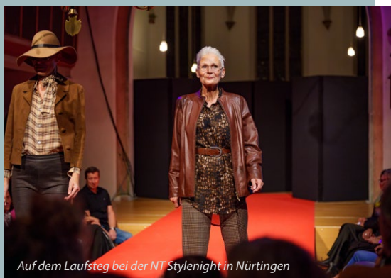
Auf dem Laufsteg bei der NT Stylenight in Nürtingen

Neben dem regulären Verkauf sind unsere Boutiquen Orte des Engagements. Auf der Engagementmesse in Ulm stand das Ehrenamt im Mittelpunkt. SECONTIQUE lebt vom Mitmachen. Neben Kleidung können Interessierte auch Zeit spenden und unsere Teams bei der Spendenannahme, bei der Sortierung, in der Warenpräsentation oder im Verkauf unter-